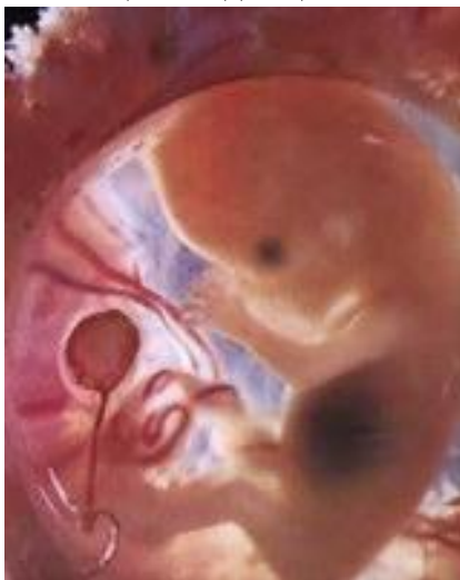
2 месеца и 3 седмици