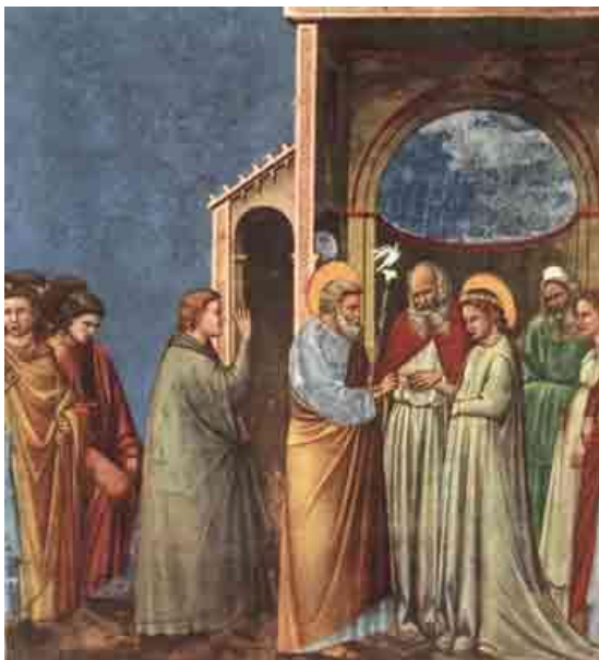
Джотто: Венчавка между Блажена Дева Мария и Свети Йосиф

Един дар така радикален, че въпреки опазвайки девствеността на Мария, станахте една плът повече, отколкото са една плът съпрузите във върховния момент на любовта. Ти не изискваш нищо, дори от Бога. И това не заради гордост, но заради ангажираността на любовта. Даваш всичко безвъзмездно! Затова ще бъдеш един добър баща, и това е сигурно!