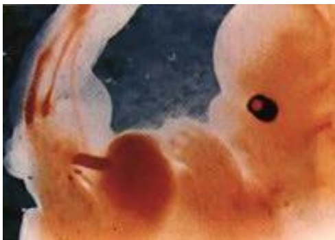
1 месец и 2 седмици